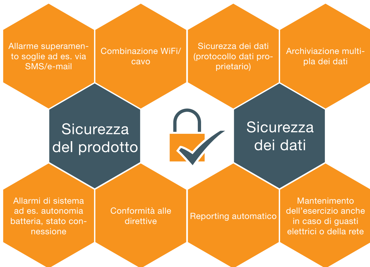
Figura 3: Sicurezza del prodotto e dei dati

Per quanto riguarda la protezione dei dati (v. Fig. 3), occorre implementare dei meccanismi che impediscano la visione o la modifica dei dati da parte di soggetti terzi.