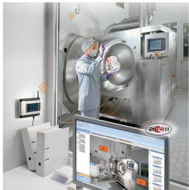
Figura 1: Ambiente farmaceutico (fonte di tutte le immagini: Testo SE & Co. KG).

Anche se con un monitoraggio non è possibile escludere completamente tutti i rischi, possono essere contenuti entro livelli accettabili.