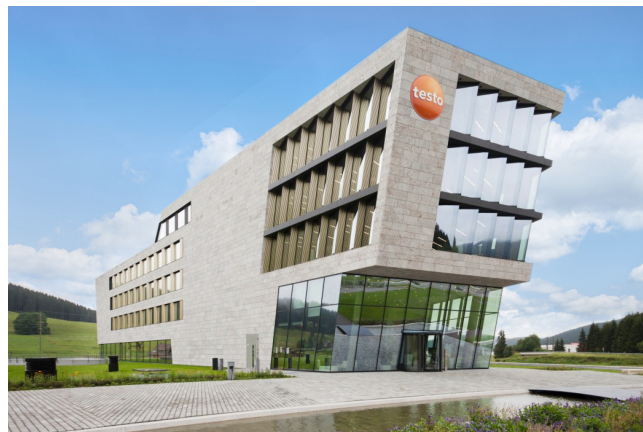
Figura 4: Il quartier generale Testo a Titisee-Neustadt (Germania)

Maggiori informazioni sono disponibili all'indirizzo testo.it